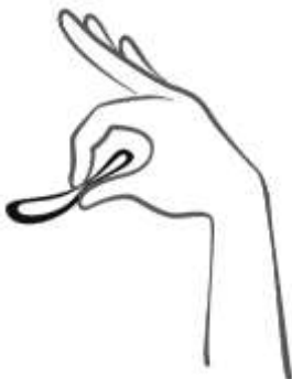
Afbeelding 2. Druk de ring samen